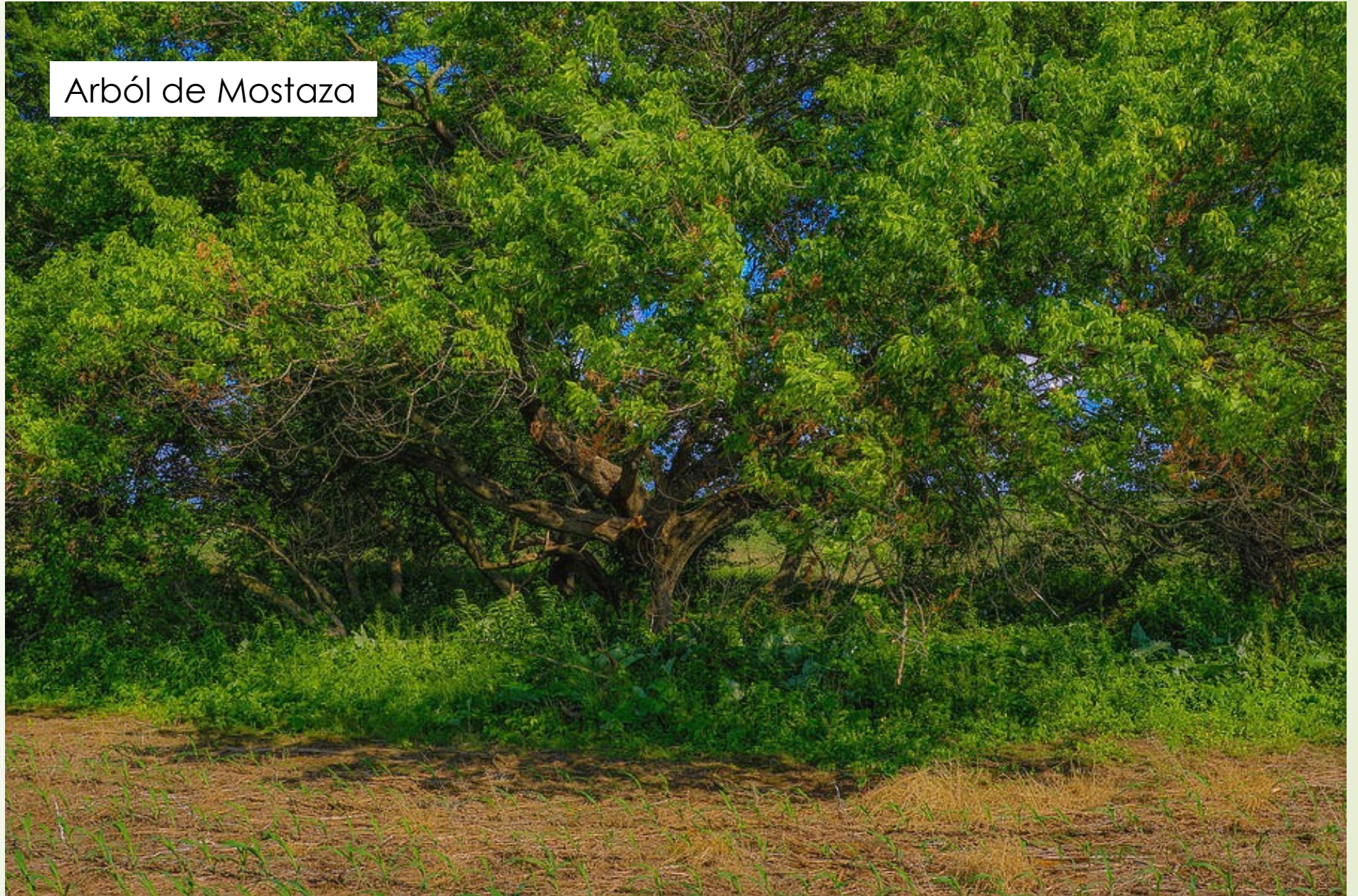
Arból de Mostaza